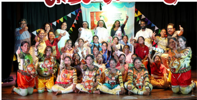
ദേശീയ വനിതാ നാടകോത്സവത്തിൽ തൃശ്ശൂർ ആരോഗ്യവകുപ്പിന് അവതരിപ്പിച്ച പെൺപെരുമ നാടകത്തിൽനിന്ന്

തലസ്ഥാനത്ത് ഡിസംബർ 27 മുതൽ 29 വരെ നടന്ന നാടകോത്സവത്തിൽ തൃശ്ശൂരിന്റെ പെൺപെരുമ എന്ന നാടകം ഏറെ പ്രശംസ പിടിച്ചുപറ്റി. വിവിധ ഭാഷകളിലുള്ള നാടകങ്ങൾ അവതരിപ്പിച്ച തിയ്യൂർ ഫെസ്റ്റിവലിൽ കേരളത്തിൽ നിന്ന് ആശ്രമകാരുടെ നാടകവും കുടുംബശ്രീ പ്രവർത്തകരുടെ നാടകവുമാണ് അവതരിപ്പിച്ചത്. ആശ്രമകാരുടെ നാടകം തൃശ്ശൂരിലെ ആശ്രമകാരുടെ കളക്ടീവ് ആണ് ദേശീയ ആരോഗ്യ ഭൗതികത്തിന്റെ നേതൃത്വത്തിൽ ആരോഗ്യവകുപ്പിന്റെ സഹകരണത്തോടെ ഒരുക്കിയത്.