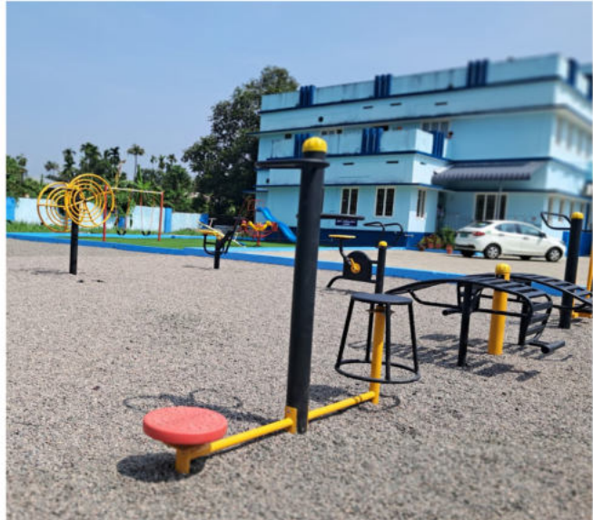
എലൂർ കുടുംബാരോഗ്യകേന്ദ്രത്തിൽ ഒരുക്കിയിരിക്കുന്ന ചിൽഡ്രൻസ് പാർക്ക്

എറണാകുളം : കുട്ടികളുടെ മാനസിക ഉല്ലാസം ലക്ഷ്യമിട്ട് ആകർഷകമായ ചിൽഡ്രൻസ് പാർക്ക് ഒരുക്കി എലൂർ കുടുംബാരോഗ്യകേന്ദ്രം. എലൂർ നഗരസഭയിൽ സ്ഥിതി ചെയ്യുന്ന കേന്ദ്രത്തിലാണ് ട്രാവൻകൂർ കൊച്ചിൻ കെമിക്കൽസിന്റെ സഹായത്തോടെ പാർക്കൊരുക്കിയത്. 2018ലെ പ്രളയത്തിൽ പൂർണ്ണമായും മുങ്ങിപ്പോയ ആരോഗ്യകേന്ദ്രമായിരുന്നു എലൂർ പ്രാഥമികാരോഗ്യകേന്ദ്രം. സി എസ് ആർ ഫണ്ടും ദേശീയ ആരോഗ്യസൗകര്യം ഫണ്ടും ഉപയോഗിച്ചാണ് ആധുനികമായ സൗകര്യങ്ങളോടെ ആരോഗ്യകേന്ദ്രത്തെ നവീകരിച്ച് കുടുംബാരോഗ്യകേന്ദ്രമാക്കിയത്. 4.28 കോടി രൂപയുടെ വികസനമാണ് ഇതിലൂടെ സാധ്യമായത്. ജീവിതശൈലീരോഗനിയന്ത്രണത്തിന്റെ ഭാഗമായി മുനിസിപാലിറ്റി നടത്തിവരുന്ന പ്രവർത്തനങ്ങളുടെ ഭാഗമായാണ് ചിൽഡ്രൻസ് പാർക്ക് സാധ്യമാക്കിയത്. പരിമിതമായ സ്ഥലമാണ് ആശുപത്രിക്ക് ഉള്ളതെങ്കിലും ജിമ്മും ചെറിയ കളിസ്ഥലവും ഒരുക്കി മെച്ചപ്പെട്ട സൗകര്യങ്ങൾ പൊതുജനങ്ങൾക്ക് ലഭ്യമാക്കാനുള്ള പ്രവർത്തനങ്ങളിലാണ് ആരോഗ്യകേന്ദ്രം. ജീവിതശൈലീ രോഗബോധവൽക്കരണം, കുട്ടികളുടെ മാനസിക ഉല്ലാസം ഉറപ്പുവരുത്തുക തുടങ്ങിയ ആശയങ്ങളാണ് ഈ പദ്ധതിയിലൂടെ ലക്ഷ്യം വയ്ക്കുന്നത്.