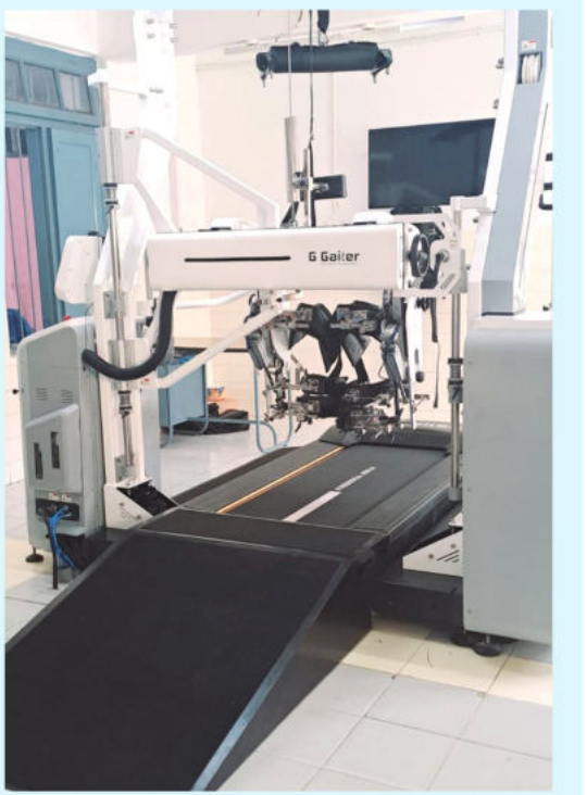
ജനറൽ ആശുപത്രിയിൽ സജ്ജമാക്കിയിരിക്കുന്ന ജീ ഗെയ്റ്റർ