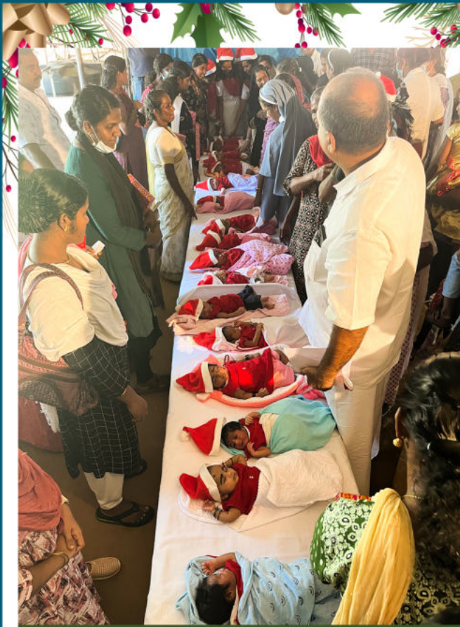
ക്രിസ്മസ് ദിനത്തോടനുബന്ധിച്ച് കാഞ്ഞിരപ്പള്ളി ജനറൽ ആശുപത്രിയിൽ സംഘടിപ്പിച്ച നവജാത ശിശുക്കളുടെ സംഗമം

കോട്ടയം: ജില്ലയിലെ ആരോഗ്യരംഗത്തെ നേട്ടങ്ങളും ഭാവിയ്ക്കുള്ള സ്വപ്നങ്ങളും പങ്കുവെച്ച് ഏറ്റുമാനൂർ നിയോ ജകമണ്ഡലത്തിലെ നവകേരള സദസ്സിൽ ആരോഗ്യ കോൺക്വെസ്റ്റ് സംഘടിപ്പിച്ചു. കോട്ടയം മെഡിക്കൽ കോളേജ് കോമ്പൗണ്ടിലെ നഴ്സിങ് കോളേജ് ഓഡിറ്റോറിയത്തിൽ ആണ് 'ആരോഗ്യ നവകേരളം, ഇന്നലെ, ഇന്ന്, നാളെ' എന്ന വിഷയത്തിൽ ചർച്ച സംഘടിപ്പിച്ചത്. കോട്ടയം മെഡിക്കൽ കോളേജിന്റെ മികവ് കൊണ്ട് ആരോഗ്യ ചികിത്സാരംഗത്ത് ഒരുപാട് മുന്നേറ്റങ്ങൾ നടത്താൻ സാധിച്ചു. അതോടൊപ്പം ഒരു സമഗ്ര മാനസിക ആരോഗ്യകേന്ദ്രം കൂടി മധ്യ കേരളത്തിൽ സാധ്യമാക്കണമെന്ന് അഭിപ്രായം ഉണ്ടായി. മെഡിക്കൽ കോളേജ് സൂപ്രണ്ട്, മറ്റ് വിഭാഗ മേധാവികൾ, ജില്ലാ കളക്ടർ, വിവിധ പഞ്ചായത്തിലെ ജനപ്രതിനിധികൾ, പഞ്ചായത്ത് ഡെപ്യൂട്ടി ഡയറക്ടർ എന്നിവർ യോഗത്തിൽ പങ്കെടുത്തു.