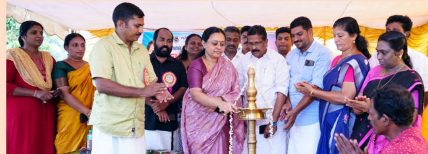
മയിലാടുംപാറ - താഴം നഗര ജനകീയ ആരോഗ്യ കേന്ദ്രത്തിന്റെ ഉദ്ഘാടനം മന്ത്രി വീണാ ജോർജ് നിർവഹിക്കുന്നു