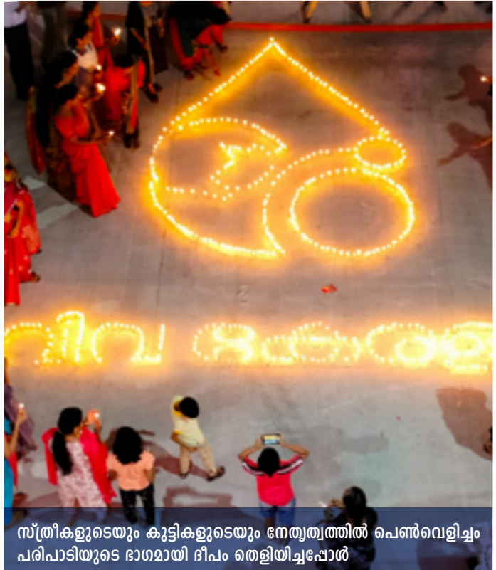
സ്ത്രീകളുടെയും കുട്ടികളുടെയും നേതൃത്വത്തിൽ പെൺവെളിച്ചം പരിപാടിയുടെ ഭാഗമായി ദീപം തെളിയിച്ചപ്പോൾ

തൃശ്ശൂർ ജില്ലയിൽ വിമലാ കോളേജിൽ നടന്ന ന്യൂ ട്രീഷൻ എക്സ് പോയുടെ ഭാഗമായി വിദ്യാർത്ഥികൾക്കായി ഹീമോഗ്ലോബിൻ പരിശോധന സംഘടിപ്പിച്ചു. കുട്ടികളുടെ നേതൃത്വത്തിൽ ഫ്ലാഷ് മൊബ്, ആശാ പ്രവർത്തകരുടെ നേതൃത്വത്തിൽ ശികാരിമേളം എന്നിവയും നടന്നു. കൂടാതെ വരുംദിവസങ്ങളിൽ ജില്ലയുടെ വിവിധ ഭാഗങ്ങളിലായി വിളർച്ചാ ബോധവൽക്കരണ സന്ദേശം നൽകുന്ന ഓട്ടൻ തുള്ളൽ അരങ്ങേറ്റം.