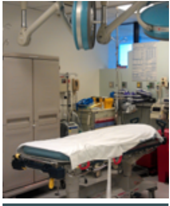
വിവിധ തരം ഫുൾ ബോഡി ഹൈ ഫിഡലിറ്റി സിമുലേറ്ററുകൾ വാങ്ങുന്നതിനാണ് തുക അനുവദിക്കുന്നത്