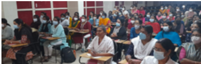
എം എൽ എസ് പി ആദ്യ ബാച്ച് പരിശീലനത്തിൽ പങ്കെടുക്കുന്നവർ

തൃശ്ശൂർ: ജില്ലയിലെ മിഡ് ലെവൽ സർവ്വീസ് പ്രൊവൈഡർമാർക്ക് ഹാൻഡ്സ് ഓൺ ക്ലിനിക്കൽ ട്രെയിനിങ്ങിന് ജില്ലയിൽ തുടക്കമായി. സർക്കാർ മെഡിക്കൽ കോളേജിൽ ആരംഭിച്ച പരിശീലന പരിപാടിയിൽ ഒരു ബാച്ചിൽ 60 എം.എൽ.എസ്.പി.മാർ വീതമാണ് പങ്കെടുക്കുക. ഫെബ്രുവരി ആദ്യവാരം ആരംഭിച്ച പരിശീലനം മാർച്ച് 20 ഓടെ അവസാനിക്കുന്ന വിധത്തിലാണ് പരിശീലനം ക്രമീകരിച്ചിരിക്കുന്നത്. ഇതോടെ 367 എം.എൽ.എസ്.പി.മാർക്ക് പരിശീലനം ലഭിക്കും. മെഡിസിൻ, സർജറി, ശിശുരോഗം, ഗൈനക്കോളജി, എമർജൻസി കെയർ, ദന്തരോഗം എന്നീ വിഷയങ്ങളിലാണ് 40 ദിവസം നോട്ടേഷണൽ ട്രെയിനിങ്ങ് നൽകുക.