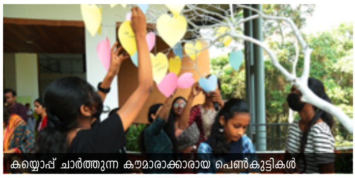
കയ്യൊപ്പ് ചാർത്തുന്ന കൗമാരക്കാരുടെ പെൺകുട്ടികൾ