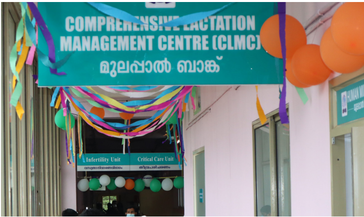
അമൃതമേകാൻ: കോഴിക്കോട് മെഡിക്കൽ കോളേജിൽ ആരംഭിച്ച മുലപ്പാൽ ബാങ്ക്

കോഴിക്കോട്: പലവിധ കാരണങ്ങളാൽ മുലയുട്ടാൻ സാധിക്കാത്ത അമ്മമാർക്ക് ഇനി ആശ്വസിക്കാം. സംസ്ഥാനത്ത് ആദ്യമായി ഒരു സർക്കാർ മെഡിക്കൽ കോളേജിൽ മുലപ്പാൽ ബാങ്ക് ആരംഭിച്ച ചരിത്രത്തിന്റെ ഭാഗമാവുകയാണ് കോഴിക്കോട് മെഡിക്കൽ കോളേജ്. അമ്മയുടെ രോഗാവസ്ഥ അല്ലെങ്കിൽ മരണം, പാൽ ഉൽപാദനം കുറയുക എന്നീ കാരണങ്ങളാൽ കുഞ്ഞുങ്ങൾക്ക് മുലപ്പാൽ ആവശ്യമായ തോതിൽ ലഭ്യമാവാത്ത സാഹചര്യം വരാറുണ്ട്. ഈ അവസരത്തിൽ കുഞ്ഞുങ്ങൾക്ക് മുലപ്പാൽ ലഭ്യമാക്കുക എന്ന ഉദ്ദേശ്യത്തോടെയാണ് മുലപ്പാൽ ബാങ്ക് ആരംഭിച്ചിരിക്കുന്നത്.