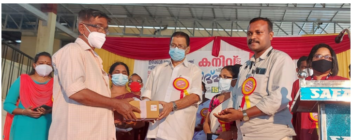
തദ്ദേശ-സ്വയംഭരണ എക്സൈസ് വകുപ്പ് മന്ത്രി എം.വി ഗോവിന്ദൻ ഡയാലിസിസ് രോഗികൾക്കുള്ള മരുന്നും വിതരണം ചെയ്യുന്നു.

കണ്ണൂർ: ഡയാലിസിസ്, വൃക്ക രോഗികൾക്ക് താങ്ങായി മാറുകയാണ് ഇരിക്കൂർ ബ്ലോക്ക് പഞ്ചായത്തിന്റെ 'കനിവ്' പദ്ധതി. പഞ്ചായത്തിന്റെ വാർഷിക പദ്ധതിയിലുൾപ്പെടുത്തി നടപ്പാക്കുന്ന കനിവ് 2021 പദ്ധതി മയ്യിൽ സാമൂഹ്യ ആരോഗ്യ കേന്ദ്രത്തിൽ തദ്ദേശ-സ്വയംഭരണ എക്സൈസ് വകുപ്പ് മന്ത്രി എം.വി ഗോവിന്ദൻ ഉദ്ഘാടനം ചെയ്തു. ബ്ലോക്കിന്റെ കീഴിലെ എട്ട് പഞ്ചായത്തുകളിലെ 134 പേർക്ക് ഒരു വർഷത്തേക്ക് എല്ലാ മാസവും മരുന്നും ഡയാലിസിസ് കിറ്റും നൽകുന്നതാണ് പദ്ധതി.