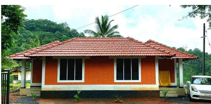
വൈത്തിരിയിലെ ഗർഭകാല ഗോത്രമന്ദിരം

കൽപ്പറ്റ; ആദിവാസി വിഭാഗങ്ങളിലെ മാതൃശിശു മരണനിരക്ക് കുറയ്ക്കുന്നതിനും ഗർഭകാല പരിചരണം ഉറപ്പാക്കുന്നതിനുമായി സംസ്ഥാന സർക്കാറും ജില്ലാ ആരോഗ്യവകുപ്പും ചേർന്ന് ഗർഭകാല ഗോത്രമന്ദിരങ്ങൾക്ക് തുടക്കം കുറിച്ചു. പ്രസവ സംബന്ധമായ പല ബുദ്ധിമുട്ടുകളും ആദിവാസി സ്ത്രീകൾ നേരിടുന്നുവെങ്കിലും ആശുപത്രികളിൽ പോവാൻ പലപ്പോഴും ഇവർ മടിക്കുന്നു. ഇതൊരു സാഹചര്യത്തിലാണ് ആശുപത്രികളിലെ പ്രസവം പ്രോത്സാഹിപ്പിക്കുന്നതിന്റെ ഭാഗമായി ഗർഭകാല ഗോത്രമന്ദിരങ്ങളൊരുക്കിയത്. സുൽത്താൻ ബത്തേരി, വൈത്തിരി താലൂക്ക് ആശുപത്രികൾക്കു കീഴിൽ രണ്ട് വിതവുമാനം സൗകര്യം, അപ്പപ്പറ, വാഴവറ്റ ആശുപത്രി പരിസരങ്ങളിൽ ഒന്നു വിതവുമായി ജില്ലയിൽ ആകെ ഏഴ് യൂണിറ്റുകളാണുള്ളത്. നൂൽ